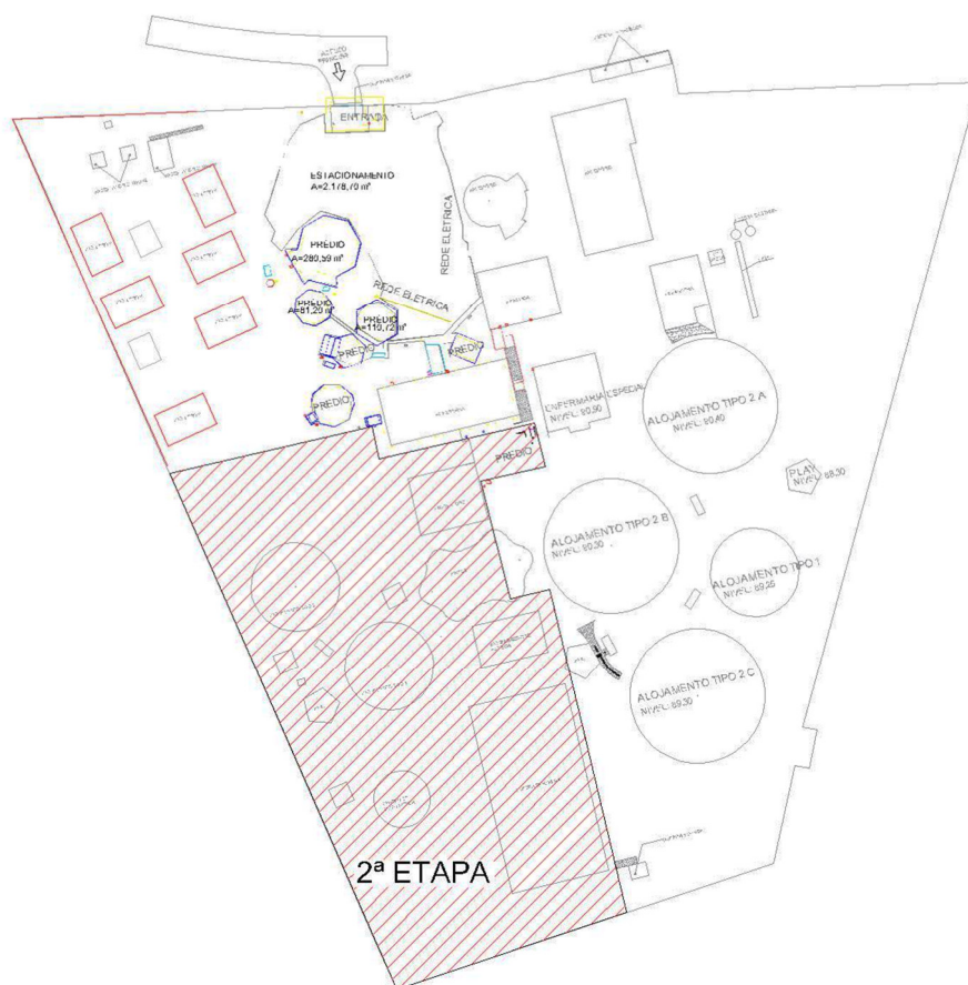
Figura 3 – Planta do canteiro de obras – etapa 2;

Também fazem parte desta etapa a execução dos sistemas de drenagem, paisagismo, conformação de taludes e a implantação de todos os demais elementos previstos em projeto executivo, assegurando a plena funcionalidade e integração das áreas intervenientes.