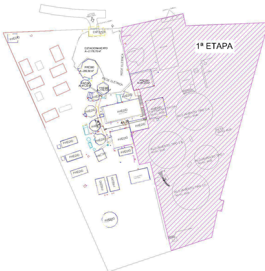
Figura 2 – Planta do canteiro de obras – etapa 1;

De forma detalhada, a 1ª Etapa contempla os seguintes serviços: