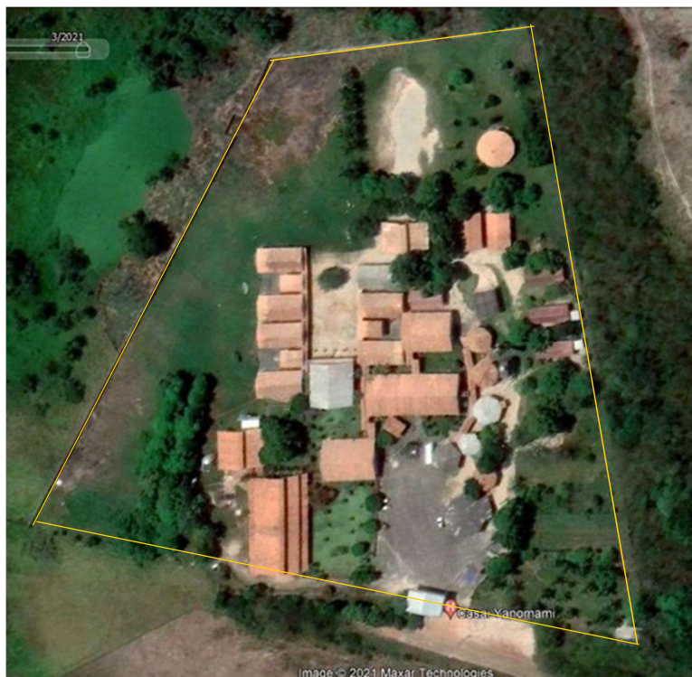
Figura 1 – Limite da área de implantação da CASAI Yanomami;

O espaço total disponível para todos os blocos da CASAI Yanomami abrange aproximadamente 44.721M 2 de área de terreno como mostra figura abaixo.