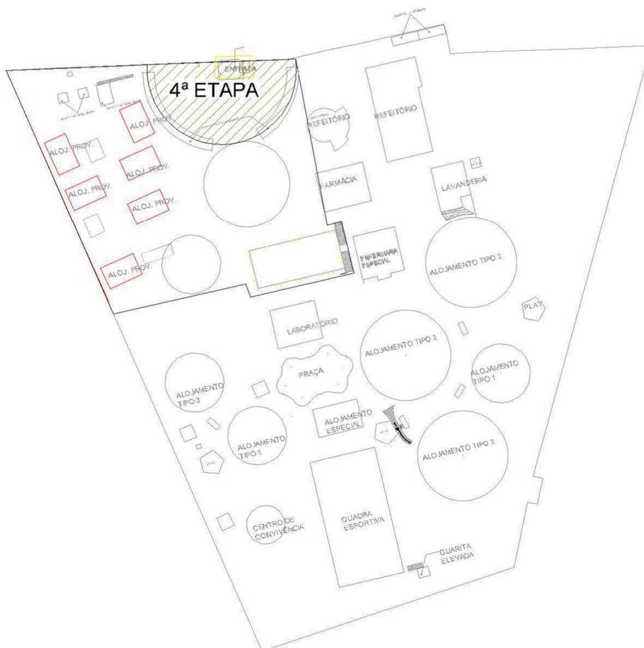
Figura 5 – Planta do canteiro de obras – etapa 4;

A execução do estacionamento compreenderá todos os serviços necessários, incluindo pavimentação, sinalização, drenagem, paisagismo, conformação de taludes e implantação das redes de infraestrutura, como sistemas elétricos, hidrossanitários e de iluminação, conforme previsto em projeto executivo.